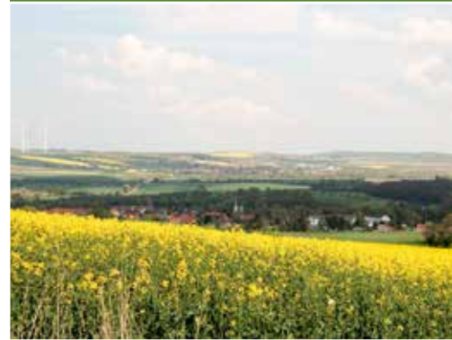
Rapsfelder vor Deersheim

Der Jahresniederschlag in Sachsen-Anhalt steigt seit 1881 tendenziell leicht an, bei starken jahreszeitlichen Änderungen.