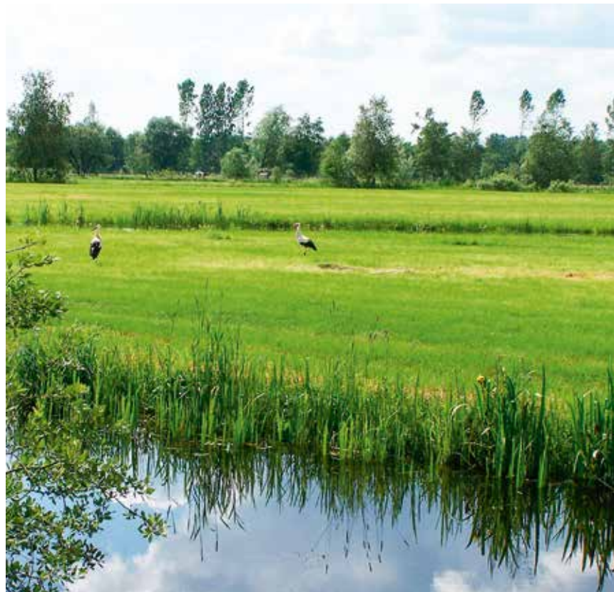
Weißstörche am Köckter Damm

40 Projekte mit einem Fördervolumen von ca. 3,5 Millionen Euro wurden im Bereich des Klimaschutzes und der erneuerbaren Energien in der Förderperiode 2007-2013 mittels einer Klimaschutzrichtlinie unterstützt. Dadurch wurden Investitionen in Höhe von ca. 4,6 Millionen Euro ausgelöst. Auch wurden über die Richtlinie vier energetische Modellregionen in Sachsen-Anhalt mit fünf so genannten Kernkommunen finanziell unterstützt. Gleichzeitig starteten sechs Kommunen mit dem European Energy Award. Dies wird intensiv durch die Landesenergieagentur (LENA) begleitet. Eine weitere Förderung innovativer Maßnahmen wird in der neuen Periode mit der Richtlinie KLIMA II angestrebt.