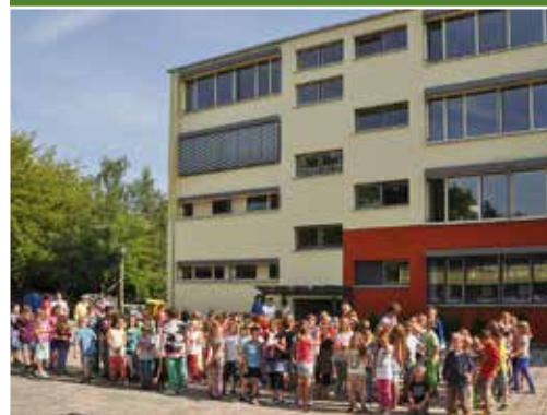
„Fit und stark fürs Leben – die bewegte Grundschule Torgarten“ in der Lutherstadt Eisleben