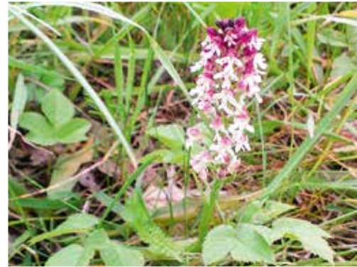
An vielen geschützten Standorten gedeihen seltene Pflanzen wie dieses Purpur-Knabenkraut im Huy bei Sargstedt

Neben dem vorrangigen Schutz der Natur soll in den Großschutzgebieten unsere Umwelt für die Menschen erlebbar gemacht werden. Eine gezielte Besucherlenkung soll dabei Konflikte zwischen Naturschutz und Tourismus vermeiden. Hierzu bieten sich z. B. beschilderte Wanderwege, Mountainbike-Routen, Schutzhütten und Aussichtspunkte an. In Zusammenarbeit mit den Biosphärenreservaten werden Reiseführer wie z. B. „Unterwegs im Biosphärenreservat Karstlandschaft Südharz“ oder „Biosphärenreservat Mittelelbe“ herausgegeben. Aktivitäten wie Wandern oder Radfahren laden zur Wiederentdeckung des Nahraumes und zur Identifikation mit Heimat ein. Wer sich mit Neuem vertraut macht und Vertrautes neu entdeckt, begreift den Begriff Heimat durch eigenes Erleben. Schutz und Erhaltung dieser Gebiete liegen deshalb im Interesse der Kommunen und regionalen Akteure.