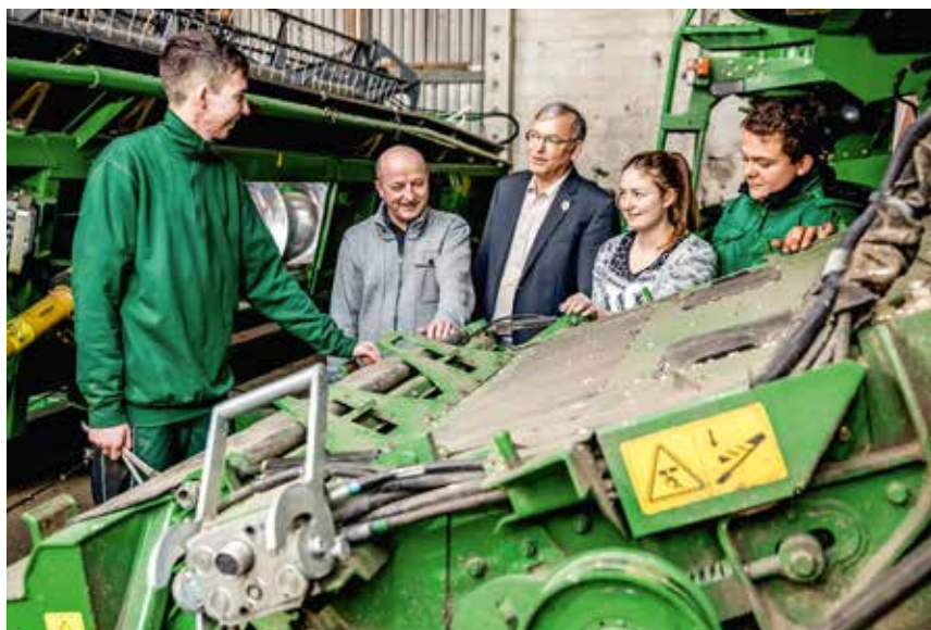
Nachwuchskräfte in der Landwirtschaft