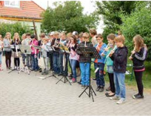
Löberitzer Grundschüler musizieren

Fachkräftemangel eine Bedrohung für die regionale Wirtschaftskraft dar.