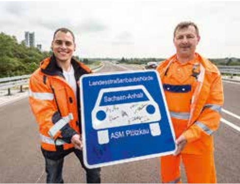
Verkehrsfreigabe der Bundesstraße B 6n, Ortsumgehung Bernburg

schaften im umliegenden Gebiet. Ein weiteres Beispiel ist der Weiterbau der A 14 als Lückenschluss in Sachsen-Anhalt zwischen Magdeburg und Wittenberge, der durch einen schnellen Zugang zu einer Autobahn die Anbindungsqualität der Region Altmark deutlich verbessert wird. Auch die Vielzahl der neu gebauten Ortsumgehungen, welche die jeweiligen Ortslagen entlastet und die Verbindungsqualität deutlich erhöht haben, tragen zu einer verbesserten Verkehrsanbindung des ländlichen Raums bei.