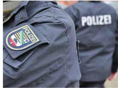
Ausschnitt Dienstuniform LSA mit Ärmelabzeichen