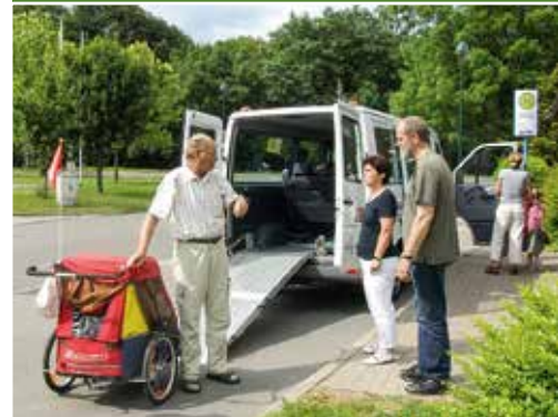
Alternative Bedienformen und Ehrenamt sichern die Mobilität im ländlichen Raum

Darüber hinaus wird in die Radwegeinfrastruktur des Landes investiert. Dies dient nicht nur der Erhöhung der touristischen Attraktivität, sondern auch einer verbesserten Mobilität, da sich viele Wege im ländlichen Raum gut mit dem Fahrrad bewältigen lassen. Radwege eröffnen nichtmotorisierten Einwohnern flexible Möglichkeiten der Fortbewegung. Das Fahrrad ist insbesondere für den Schülerverkehr vorteilhaft, weil es Kindern und Jugendlichen eine unabhängige Mobilität bietet. Oftmals ist Fahrrad fahren aber auch für ältere Bürger – ggf. mit Elektrofahrrad – eine Alternative, nahliegende Zielorte zu erreichen.