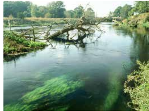
Unsere Flüsse: Lebensraum für Flora und Fauna

Unsere Kulturlandschaft hat von bereits durchgeführten Maßnahmen nachhaltig profitiert. Und auch auf das Grundwasser, dessen Verbesserung ebenfalls eine wichtige Aufgabe bei der Umsetzung der Europäischen Wasserrahmenrichtlinie ist, haben sich die Maßnahmen positiv ausgewirkt. Gerade in unserem Bundesland findet man – zumeist in den Ballungsräumen der ehemaligen Industriezentren der DDR – durch Schadstoffe belastetes Grundwasser. Insbesondere in diesen ökologischen Großprojekten ist dank einer umfangreichen Altlastensanierung aus einst schwer belasteten Gebieten wieder erlebbare und liebenswerte Heimat geworden.