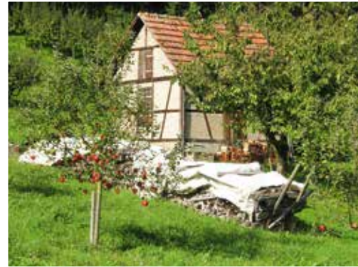
Streuobstwiese im Harzvorland

Lebendige ländliche Räume sind aber immer mehr als die Summe ihrer Infrastruktur, der Fördermittel und der Einrichtungen der Daseinsvorsorge. Im Mittelpunkt stehen die Menschen. Daher unterstützen wir bürgerschaftliches Engagement, die Mitarbeit in Vereinen, Kirchen und Verbänden. Dies ist sowohl für den Einzelnen als auch für die Gemeinschaft eine unverzichtbare Ressource, die wir umfassend nutzen müssen, um unseren ländlichen Gebieten durch soziale Verbundenheit, erreichbare Daseinsvorsorge und Mobilität einen unverwechselbaren Charakter zu geben. Gleichzeitig entstehen so Gemeinschaftserlebnisse, die Menschen miteinander vertraut und verbunden werden lassen. Heimat hat so nicht nur Zukunft, sie wird auch als Basis erfahrbar, auf deren Grundlage sich Menschen persönlich und beruflich nachhaltig entfalten können.