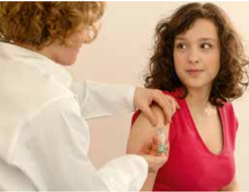
Gesundheitsvorsorge durch präventive Maßnahmen