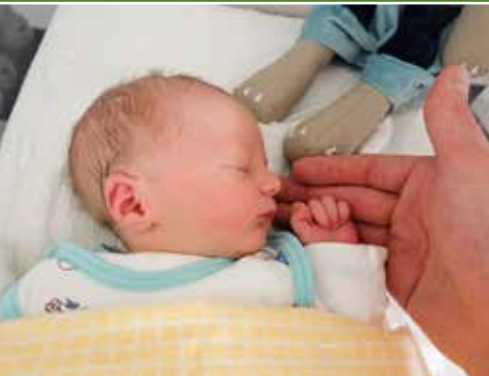
Kinder brauchen Geborgenheit

wöchentlichen Ausbildungszeit richten. Gerade für junge allein-erziehende Mütter und Väter, die in ländlichen Regionen leben und längere Anfahrtswege zum Ausbildungsbetrieb haben, wäre diese Form der Ausbildung eine Chance zur besseren Vereinbarung von Ausbildung und Familie. Leider stehen dieser Ausbildungsform noch nicht genug Unternehmen positiv gegenüber. Das Land Sachsen-Anhalt fördert bereits seit dem Jahr 2000 im Rahmen der EU-Strukturfondsperioden Projekte, die die Eingliederungschancen von Alleinerziehenden auf dem Arbeitsmarkt durch eine abgeschlossene Berufsausbildung erhöhen.