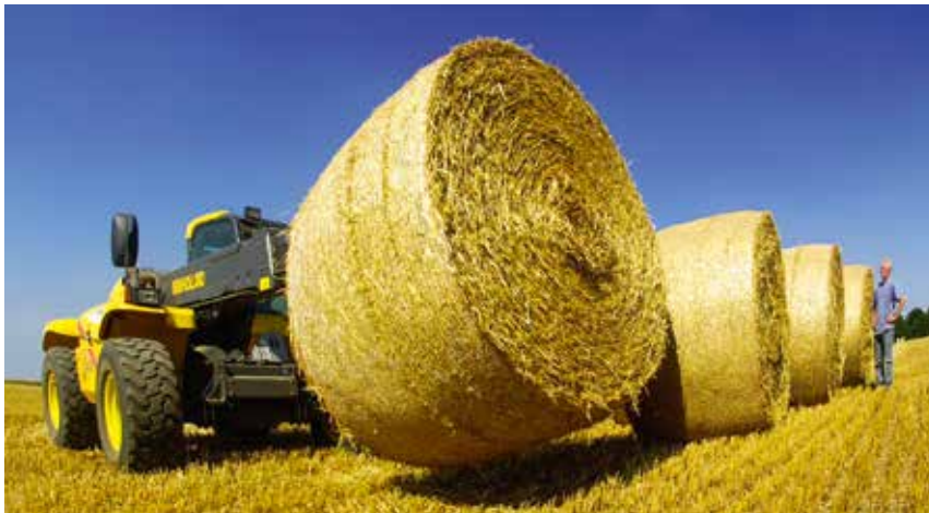
Landwirtschaft im Wandel der Zeit – Modernste Agrarfahrzeuge im Einsatz

Mit einem Anteil von ca. 61,4 Prozent wird der überwiegende Teil der Fläche Sachsen-Anhalts land- und forstwirtschaftlich genutzt. Aufgrund von topografischen und historischen Rahmenbedingungen ist Sachsen-Anhalt als Landwirtschaftsstandort geradezu prädestiniert. So ist die Magdeburger Börde als Sinnbild für fruchtbare Böden weit über Deutschland hinaus bekannt. In Eickendorf liegt das Reichsmusterstück, dessen Boden mit einer Bodenwertzahl von 100 als Bewertungsmaßstab für die Bodenqualität in Deutschland gilt.