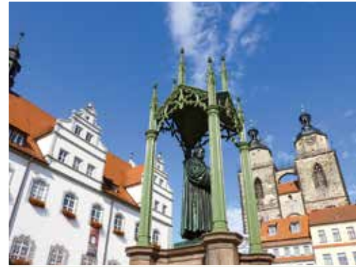
Luther-Statue in Wittenberg

Im Hinblick auf das Angebot wurden zwischen dem Jahr 2000 und heute außerhalb der Großstädte auch erhebliche Investitionen in die touristische Infrastruktur und im touristischen Gewerbe getätigt. Gemäß der Statistik der Fördermaßnahmen aus der „Gemeinschaftsaufgabe Verbesserung der regionalen Wirtschaftsstruktur“ wurden im ländlichen Raum 297 Vorhaben zum Ausbau der touristischen Infrastruktur getätigt. Die Summe der förderfähigen Investitionen lag bei rund 242 Millionen Euro; die Fördersumme bei rund 194 Millionen Euro. Im gleichen Zeitraum wurden 247 gewerbliche Investitionsvorhaben