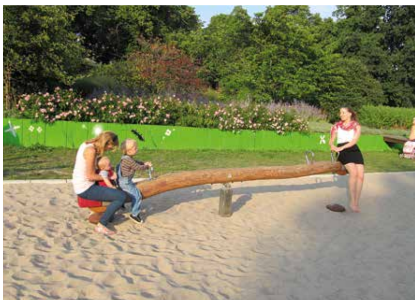
Familie und Beruf in der Balance halten

und immer öfter auch die Pflege von Angehörigen eine ernsthafte Herausforderung, Beruf und Privatleben aufeinander abzustimmen. Da nach wie vor Frauen den größten Teil dieser Verpflichtungen übernehmen, wird die Vereinbarkeit von Beruf und Privatleben oft als „Frauenthema“ gesehen. Die Landesregierung unterstützt jedoch eine partnerschaftliche Arbeitsteilung. Die Erhöhung der Vereinbarkeit von privaten Verpflichtungen verschiedenster Art und in den unterschiedlichen Lebensphasen mit Erwerbstätigkeit und beruflicher Karriere soll für beide Geschlechter erreichbar sein. Die Unterstützung mit flexiblen Arbeitszeitmodellen, die Schaffung von Möglichkeiten zum beruflichen Aufstieg und der Wahrnehmung von Führungspositionen auch in Teilzeit bis hin zur Unterstützung bei der Vereinbarkeit von Beruf und Pflege von Angehörigen, stehen dabei im Mittelpunkt.