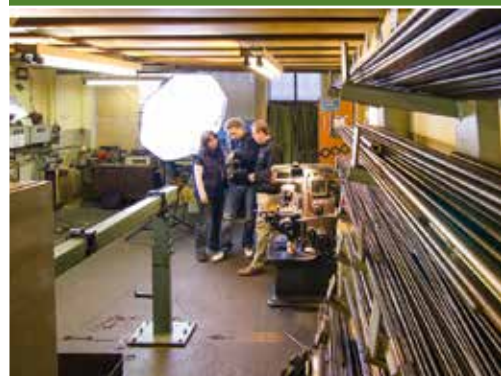
Hochspezialisierter Mittelstand – Bowdenzugmanufaktur in Quedlinburg

Das Thema „Arbeitsplätze schaffen und sichern“ ist eng mit dem Thema „Fachkräftesicherung“ verbunden. Hier muss insbesondere einer frühzeitigen, am regionalen Arbeitsmarkt ausgerichteten Berufsorientierung große Bedeutung zugemessen werden. Zudem muss verstärkt daran gearbeitet werden, dass sich das stereotype Berufs- und Studienwahlverhalten von Mädchen und Frauen ändert. Der technische Fortschritt ist inzwischen in keiner Branche mehr wegzudenken. Mit der Förderung von Projekten zur „Unterstützung von Frauen in MINT-Berufen“ (Mathematik, Informatik, Naturwissenschaft, Technik) ist das Land hier auf dem richtigen Weg. Dazu setzt das Land neben eigenen auch Mittel aus dem Europäischen Sozialfonds (ESF) ein. Bei der Entscheidung für die Förderung eines Projektes ist dabei zum einen die Notwendigkeit der Erhöhung des Anteils weiblicher Studierender in