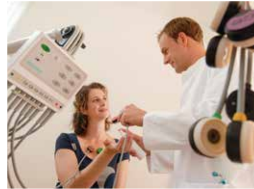
Weiterführende Untersuchungen und moderne Diagnostik bieten Gesundheitszentren und Krankenhäuser im ländlichen Raum.

Die flächendeckende Versorgung mit Arzneimitteln und apothekenpflichtigen Medizinprodukten durch 610 wohnortnahe Apotheken ist in Sachsen-Anhalt, auch im ländlichen Raum, gesichert. Trotz zunehmenden Alters der Apothekeninhaber kann über verschiedene Liberalisierungen im Apothekenrecht eine hochwertige Arzneimittelversorgung, auch in der Fläche, garantiert werden. Die Möglichkeit behördlich genehmigte Rezeptsammelstellen an abgelegenen Orten ohne Apotheke zu betreiben und die Möglichkeit, dass ein Apothekenleiter mit einer Betriebserlaubnis bis zu drei Filialen betreiben kann, haben dazu geführt, dass auch in dünn besiedelten, ländlich geprägten Gegenden im Norden des Landes, kein Versorgungsmangel zu erkennen ist, vielmehr ist über die Abgabe von Arzneimitteln hinaus ein niedrigschwelliger Zugang auch bei Fragen zu allgemeinen Gesundheitsthemen möglich.