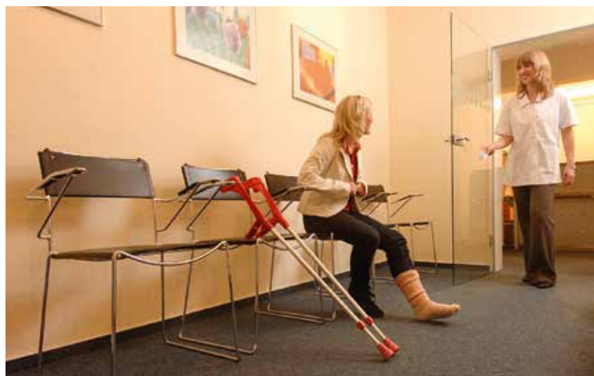
Das Ziel bleibt eine bedarfsgerechte ärztliche Versorgung möglichst nah am Wohnort.

des Landes eine zentrale Rolle, die insbesondere die Sicherung einer bedarfsgerechten und qualitativ hochwertigen Versorgung der Bevölkerung des Landes mit stationären Leistungen zum Ziel hat. Die Menschen in Sachsen-Anhalt müssen sich darauf verlassen können, nach dem neuesten medizinischen Stand und in bester Qualität behandelt zu werden. Sachsen-Anhalt setzt aus diesem Grund bereits seit vielen Jahren auf eine integrierte Bedarfs- und Qualitätsplanung. Hier orientiert sich die Krankenhausplanung nicht ausschließlich am Bedarf, sondern gleichermaßen an der Qualität. So wird gewährleistet, dass Sachsen-Anhalts Krankenhäuser auch in Zukunft gut, gut erreichbar und sicher sind. Zudem sind Krankenhäuser stark mit der Region verbunden und leisten erhebliche Anteile an der Bruttowertschöpfung und der