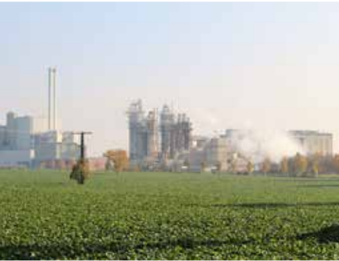
Moderner Chemiebetrieb und Arbeitgeber im ländlichen Raum – CIECH Sodawerk Staßfurt