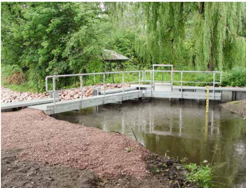
Neues Verteilerbauwerk Libbesdorfer Landgraben vor Kettmannscher Mühle

Im Regelfall wird zunächst die Erarbeitung von Konzepten bewilligt, nachfolgend die Planung der Maßnahmen und erst dann die erforderlichen Investitionen wie z.B. der Bau von Schöpfwerken oder Anlagen zur Ableitung von Grund- und Niederschlagswasser. Von den vorhandenen Mitteln in Höhe von fast 27 Millionen Euro ist inzwischen knapp die Hälfte des „Fördertopfes“ – etwa 13 Millionen Euro – bewilligt. Neben der weiteren Landesförderung stehen für die nächsten Jahre zusätzlich EU-Mittel in Höhe von 5 Millionen Euro für Maßnahmen gegen Vernässungen oder Erosion zur Verfügung.