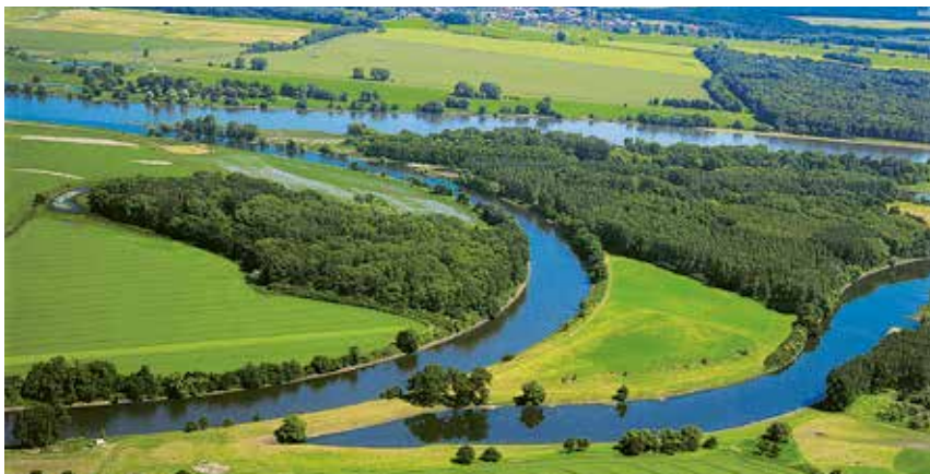
Biosphärenreservat Mittelelbe: Sachsen-Anhalts größter Fluss prägt unsere Heimat