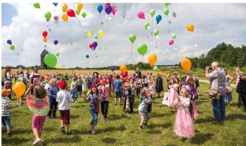
Kinder schicken ihre Zukunftsträume in den Himmel beim Kinderfest in Beetzendorf