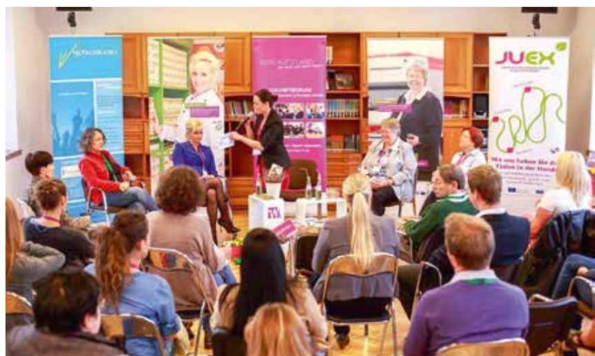
Unternehmerinnen netzwerken in Kläden (Bismark)

Die berufliche Selbstständigkeit stellt eine Erwerbsperspektive dar, die geeignet sein kann, die Position von Frauen in der Wirtschaft zu stärken. In strukturschwachen, aber auch ländlichen Regionen könnte das eine geeignete Alternative für Frauen sein. Unterstützt werden Frauen hier beispielsweise durch Gründungsberatung und -unterstützung, aber auch bei der Vernetzung und Anerkennung von Unternehmerinnen. Mit der Gründung eines Servicezentrums für Existenzgründerinnen und Unternehmerinnen wird der Zugang zu bestehenden Angeboten der Gründungsförderung erleichtert.