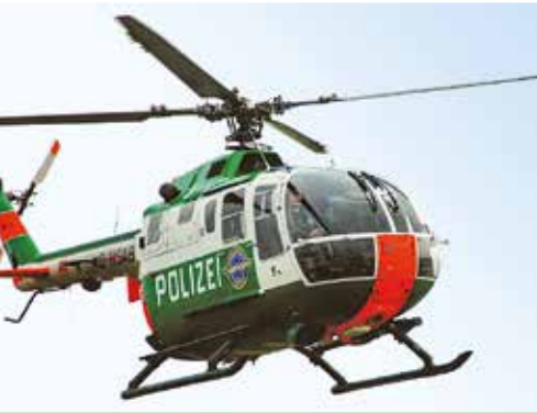
Hubschrauber der Polizei- hubschrauberstaffel Sachsen-Anhalt