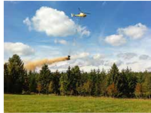
Waldkalkung im Harz

Mehr als die Hälfte des Waldes befindet sich im privaten Eigentum von über 53.000 Waldbesitzern. In staatlicher Verwaltung sind 37 Prozent der Wälder, neun Prozent sind Körperschaftswald, zu dem auch der Wald der Städte und Gemeinden gehört. Mit einer Durchschnittsgröße von nur fünf Hektar