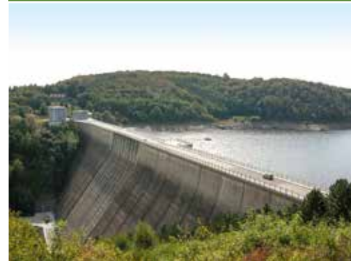
Rappbodetalsperre – Schutz vor Hochwasser, Spender von Energie und Wasser