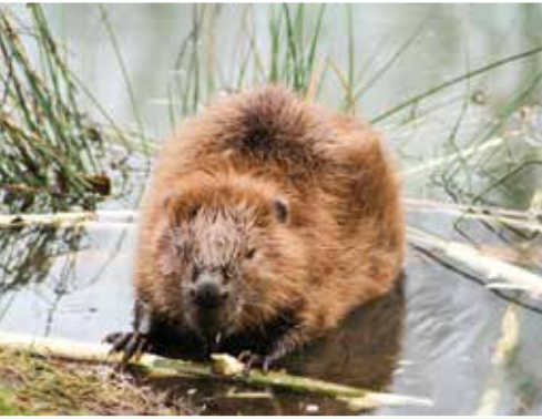
Der Biber prägt wieder verstärkt das Bild unserer heimischen Kulturlandschaft