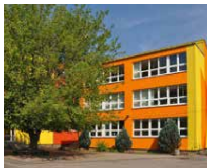
Sanierte Grundschule „Thomas Müntzer“ in der Lutherstadt Eisleben

Die Gesamtbildungsausgaben Sachsens-Anhalts im Haushaltsjahr 2012 lagen mit 7.400 Euro je Schülerin und Schüler deutlich über dem Bundesdurchschnitt (6.300 Euro pro Schülerin und Schüler). Nur die Ausgaben Thüringens (8.000 Euro), Hamburgs (7.600 Euro) und Berlins (7.500 Euro) lagen noch höher als die Sachsens-Anhalts. Der laufende Sachaufwand und die Investitionsausgaben liegen nahe dem Bundesdurchschnitt.