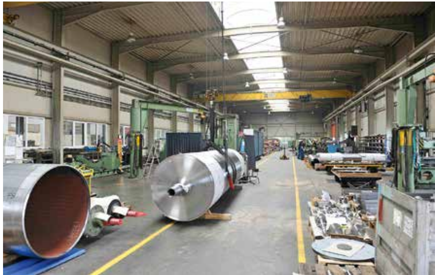
Einblick in die Walzenfertigung