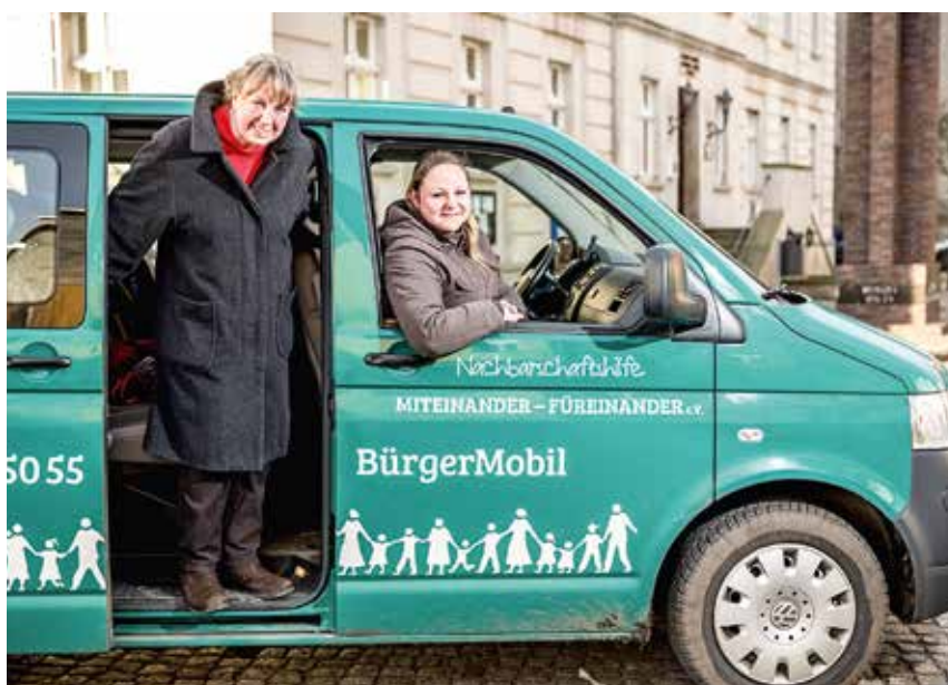
Bürgermobil in der Hansestadt Werben – eine gute Ergänzung zum ÖPNV