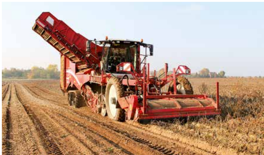
Kartoffelernte in der Magdeburger Börde

Daneben werden Maßnahmen der Öffentlichkeitsarbeit gefördert, die sich insbesondere positiv auf den ländlichen Raum auswirken. Beispiele sind das Landeserntedankfest in Magdeburg und das Harzer Landwirtschaftsfest in Reinstedt, wo Erzeuger den Verbrauchern Produkte aus der Region vorstellen und anbieten. Weitere erfolgreiche Aktionen sind die Mitteldeutsche Warenbörse, die Unternehmen die Möglichkeit gibt, sich mit regionalen Produkten vorzustellen. Wichtige Impulsgeber sind auch andere Handelsbörsen, Aktionen des Lebensmittelhandels sowie die Funk- und Fernsehwerbung. Gefördert wird zudem die Fortentwicklung der Regionalmarken „Bördeschatzkiste“, „Salzlandkiste“ und „Typisch Harz“ als direktes Angebot regionaler Lebensmittelspezialitäten an die Verbraucher.