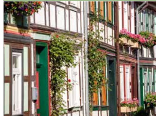
Quedlinburg: Neue Wohn- und Lebensqualität im Welterbe

Über die Leader-Konzepte wurden im genannten Zeitraum weitere, etwa 73 Millionen Euro für Vorhaben der Dorferneuerung und -entwicklung, der Umnutzung land- und forstwirtschaftlicher Bausubstanz und des Fremdenverkehrs eingesetzt. Zusammen mit GAK-Mitteln wurden in der EU-Förderperiode 2007 – 2013 für 4.827 Vorhaben nahezu 173,7 Millionen Euro bewilligt. Das Gesamtinvestitionsvolumen bei der Umsetzung dieser Vorhaben betrug – inklusive Eigenanteil der Zuwendungsempfänger – etwa 403 Millionen Euro.