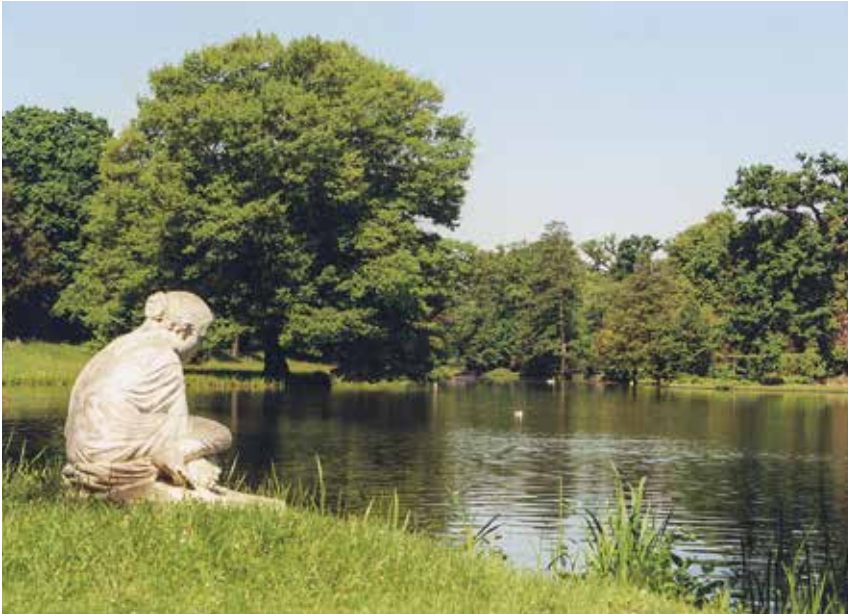
UNESCO-Welterbe Dessau-Wörlitzer Gartenreich