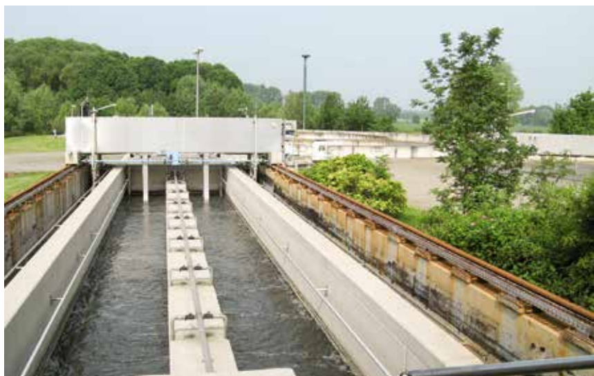
Belüfteter Langsandfang der Kläranlage Zörbig

Damit die Entgelte – insbesondere im ländlichen Raum – dauerhaft auf einem sozialverträglichen Niveau bleiben, unterstützt das Land Gemeinden und Zweckverbände bei der Erledigung der Aufgaben der Trinkwasserversorgung und der Abwasserbeseitigung. In der jetzt auslaufenden EU-Förderperiode 2007-2013 sind für die Ersterschließung an öffentliche Abwasseranlagen Mittel aus den europäischen Fonds (ELER und EFRE) in Höhe von ca. 115 Millionen Euro geflossen. Darüber hinaus wurden Mittel aus der Abwasserabgabe in Höhe von ca. 21 Millionen Euro eingesetzt. Trinkwasservorhaben im ländlichen Raum wurden in diesem Zeitraum mit knapp 18 Millionen Euro unterstützt.