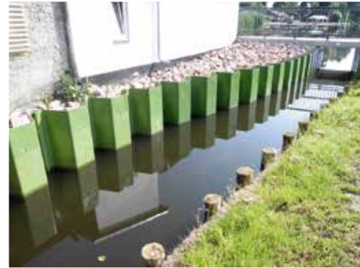
Saniertes Zulaufgraben vom Libbesdorfer Landgraben zum Mosigkauer Bad