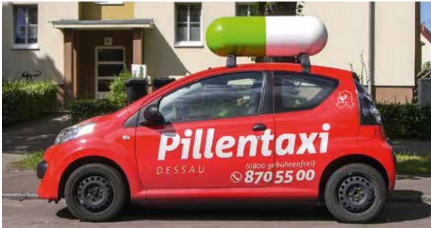
Alternative Versorgungsangebote ermöglichen