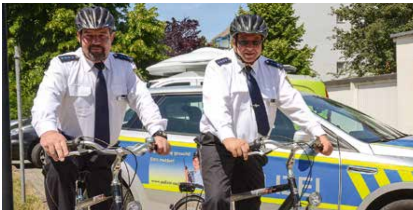
Regionalbereichsbeamte mit Dienstrad – bürgernah und flexibel

wichtig, für die Bürger in allen Landesteilen vor Ort ansprechbar zu sein (siehe Karte). Es ist daher die Aufgabe von Regionalbereichsbeamten, für Bürgerinnen und Bürger, kommunale Entscheidungsträger und Kooperationspartner erreichbar zu sein.