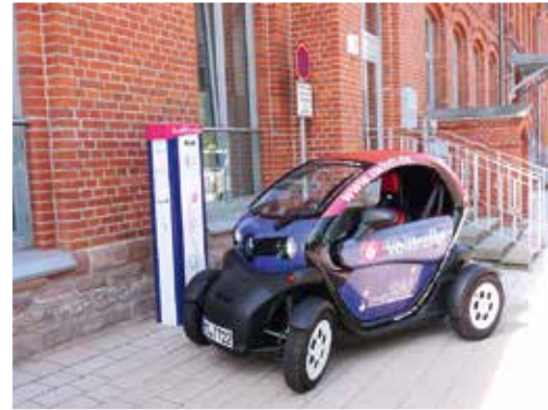
Elektromobilität – ideal für kurze Distanzen in der Stadt

Ein wichtiger Schwerpunkt besteht darin, die ländlichen Regionen flächendeckend an die übergeordneten Verkehrsnetze anzubinden, um so schnelle Verkehrsverbindungen zu ermöglichen. So erschließt z. B. die neu gebaute Bundesstraße 6n derzeit den Raum von der Landesgrenze Niedersachsen/Sachsen-Anhalt im Bereich der A 395 bis östlich von Köthen. Von dieser modernen West-Ost-Verbindung, die in den nächsten Jahren bis zur A 9 bei Thurland weitergebaut wird, profitieren sämtliche Ort-