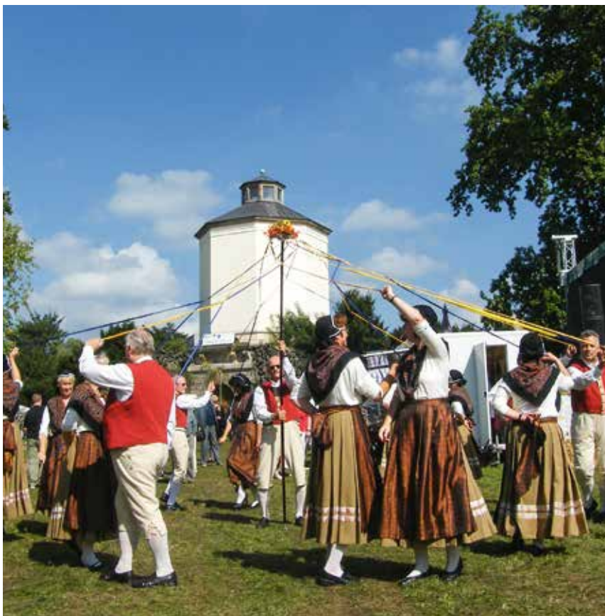
Trachtengruppe in Mildensee