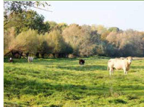
Weidewirtschaft bei Unseburg in der Börde

Ebenso ist die Nahrungs- und Futtermittelindustrie eine strukturbestimmende Branche in Sachsen-Anhalt. Mit einem Beitrag von 16,5 Prozent an den Beschäftigten und 15,4 Prozent am Umsatz im Verarbeitenden Gewerbe nimmt sie den ersten Platz im Branchenvergleich ein. Die Betriebe der Ernährungsbranche sind überwiegend