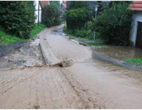
Sturzflut auf einer Straße in Richtung Siedlungsgebiet