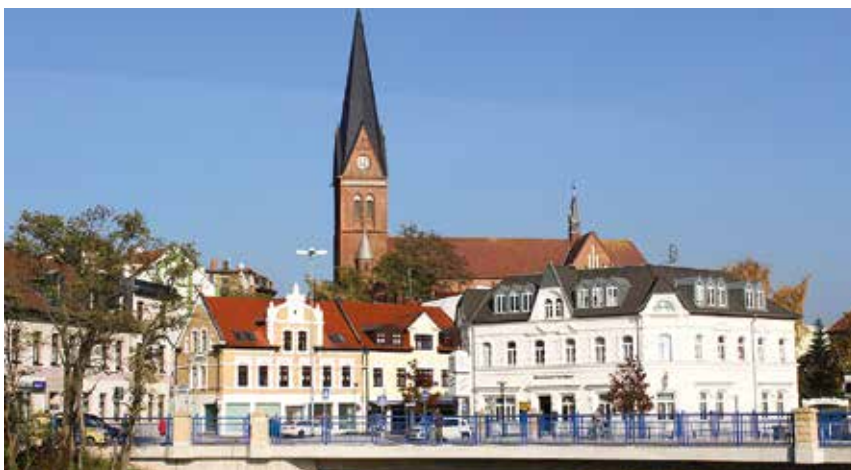
Bodebrücke mit Blick auf Staßfurt

Minister für Landesentwicklung und Verkehr des Landes Sachsen-Anhalt