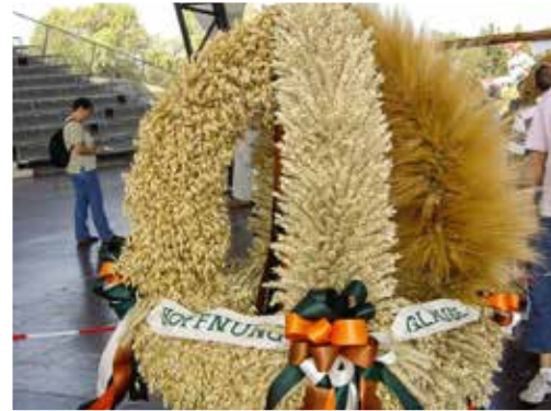
Beim Landeserntedankfest werden die schönsten Erntekronen unserer Heimat prämiert

Kommunen und Gemeinden, die bei ihren kulturellen Vorhaben eine übergreifende Kooperation anstreben oder sich zu Zweckverbänden bzw. Kulturregionen oder -räumen zusammenschließen, politisch unterstützen und nach Möglichkeit eine Anschubfinanzierung bzw. Strukturanpassungsunterstützung bereitstellen. So kann die Umsetzung der Empfehlung des Kulturkonvents Sachsen-Anhalt, dass sich die Kommunen zu Kulturregionen zusammenschließen, um Aufgaben oder Kultureinrichtungen gemeinsam zu gestalten, zu finanzieren oder zu führen, unterstützt werden.