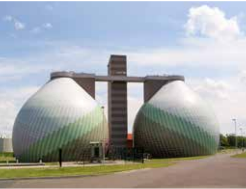
Faultürme der Kläranlage Gerwisch