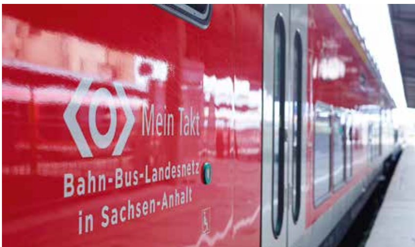
Starker Nahverkehr in Sachsen-Anhalt