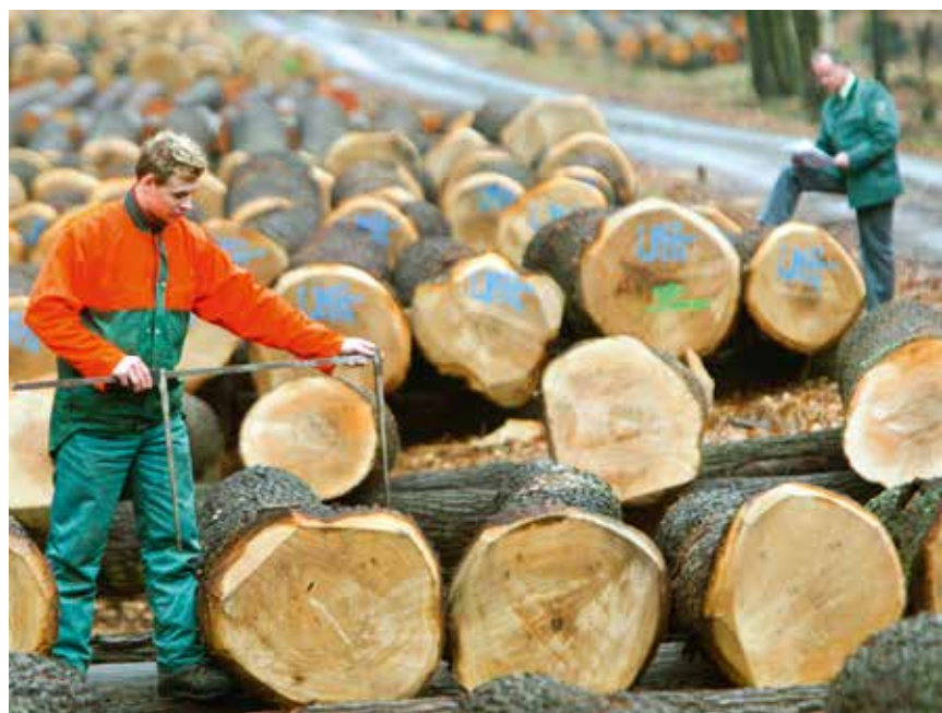
Forstarbeiter vermessen Eichenstämmе

Im ländlichen Raum haben die klein- und mittelständischen Betriebe der Forst- und Holzwirtschaft einen großen Einfluss auf die regionale Wirtschaftsentwicklung und Beschäftigungspolitik. Mit 2.000 Unternehmen und rund 18.000 Beschäftigten ist der Cluster Forst- und Holz ein mittelständisch geprägter Wirtschaftssektor. Die Holzwirtschaft in Sachsen-Anhalt hat sich durch die Neuansiedlung großer Holzverarbeitungsbetriebe in Arneburg bei Stendal, im altmärkischen Nettgau und in Rottleberode über die Landesgrenzen hinaus zu einem modernen Verarbeitungszweig entwickelt.