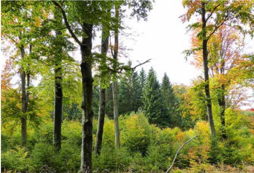
Schon Dichterrfürst Goethe wanderte gern durch die Mischwälder im Harz