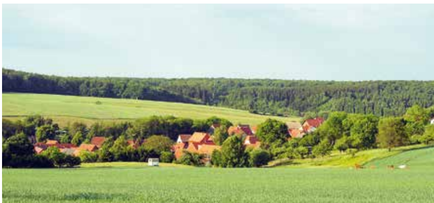
Blick auf Horla im Landkreis Mansfeld-Südharz