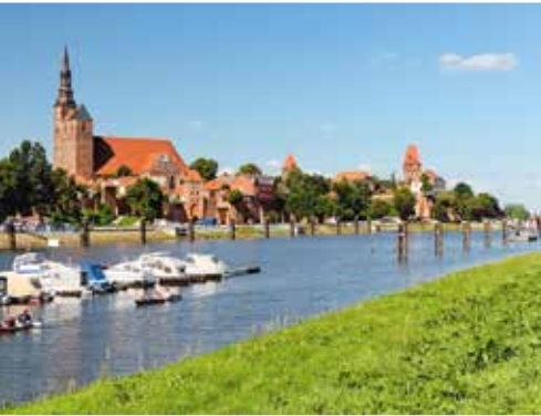
Blick über die Elbe auf das malerische Tangermünde

gefördert. Die förderfähigen Investitionen beliefen sich auf rund 320 Millionen Euro, die Fördersumme auf rund 134 Millionen Euro. Durch die Vorhaben wurden 1.176 Dauerarbeitsplätze neu geschaffen und 2.576 Arbeitsplätze gesichert.