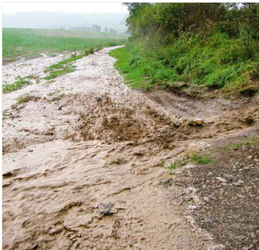
Bei einer Sturzflut zeigt die Natur ihre Gewalt

Unter anderem sollen Maßnahmen initiiert werden, damit bei der landwirtschaftlichen Bewirtschaftung Wasser und Sedimente möglichst in der Fläche gehalten werden. Zudem sollen Planung und Ausführung technischer Lösungen zum Schutz von Ortslagen und Siedlungsbereichen unterstützt werden.