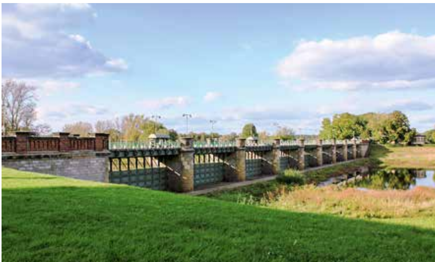
Das Pretziener Wehr – Meisterwerk der Ingenieurskunst

Um für künftige Ereignisse so gut wie möglich gewappnet zu sein, setzt Sachsen-Anhalt auch auf die Stärkung des natürlichen Wasserrückhalts und den Gewinn von Retentionsräumen. Nach dem Hochwasser im Juni 2013 wurden mögliche Standorte für die Schaffung von zusätzlichem Retentionsraum untersucht. Im Ergebnis wurde ein Katalog mit 42 potenziell geeigneten Standorten mit einer Fläche von 21.788 Hektar erarbeitet.