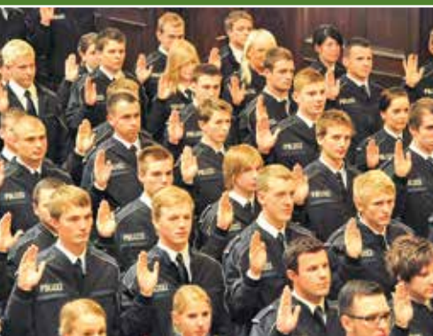
Studierende der FH Pol bei ihrer Vereidigung mit erhobener Schwurhand