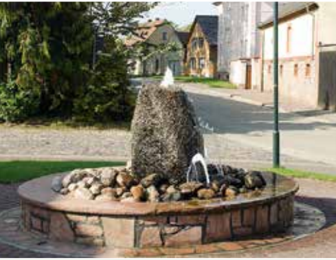
Bebertal im Landkreis Börde Einheitsgemeinde Hohe Börde