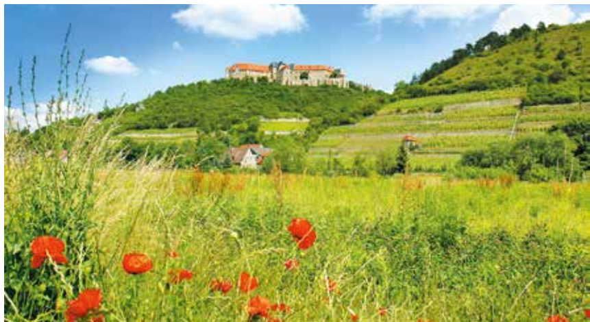
Blick auf die Neuenburg bei Freyburg/Unstrut